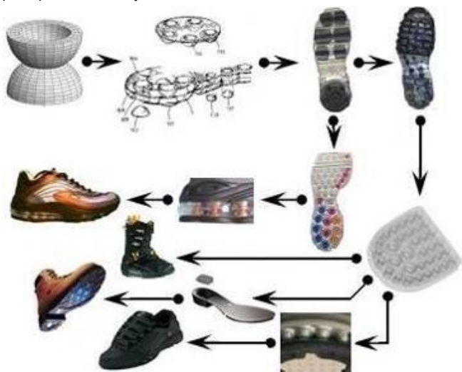
Slika 4. Postupak izrade donjišta obuće

Postoji nekoliko načina izbjegavanja mjesta maksimalnog tlaka. Jedan od načina je preraspodjela opterećenja na donjištu. Drugi način je smještanje mekih umetaka između stopala i donjišta. Deformabilna uložnica amortizira visoke pikove tlaka. Modelirana je i vrlo meka, savitljiva, sačinjena od gumiranog lateksa. Jedinствена geometrijska konstrukcijauložnice meko djeluje na stopalo i petu uzrokujući redistribuciju maksimalne razine [18, 19.] tlaka. Na slici 4. je prikazan postupak izrade donjišta obuće.