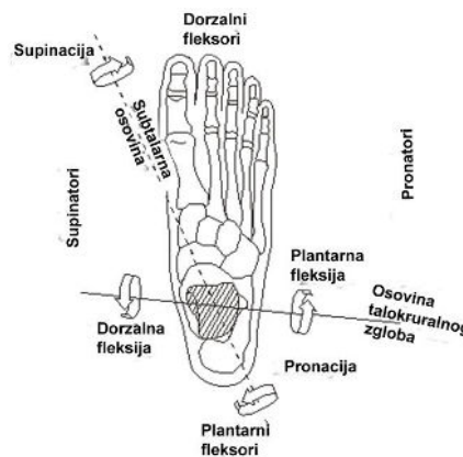
Slika 2. Tri osnovne osi gornjeg nožnog zgloba

Sveze osiguravaju gibanje u zglobovima, ali isto tako ih i ograničavaju. Stopalo ima važnu ulogu vezanu uz uspravan stav čovjeka. Ono statički nosi težinu tijela, a dinamički amortizira udare i omogućava gibanje. Održavanje ravnoteže i pokretanje tijela prema naprijed omogućeno je izmjeničnom akcijom obaju donjih udova gdje su aktivne mišićne, gravitacijske i inercijske sile. Na slici 2. su prikazane tri osnovne osi gornjeg nožnog zgloba.