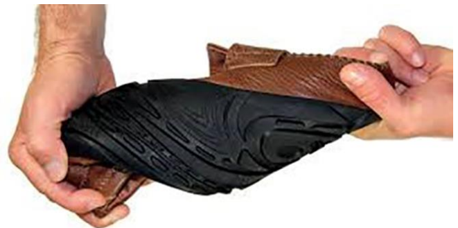
Slika 3. Test loma sportske obuće

Stoga je važno da obuća izdrži sve moguće izvanjske utjecaje. Konstrukcija obuće, između ostalog, mora zadovoljiti kriterije oštećenja uzrokovana udarnim opterećenjem. Kako je gustoća specifične energije na zadanom mjestu konstrukcije pokazatelj potencijalnog oštećenja, to se prostor oštećenja promatra u funkciji prenesenog ubrzanja/sile i razine promjene brzine za period trajanja pulsa.