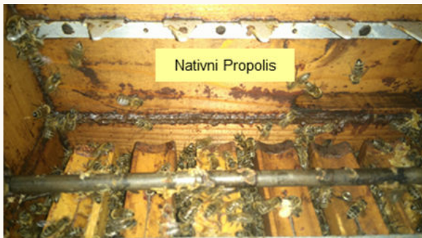
Slika1. Nativni propolis u košnici.

Kao antimikrobni agens korišten je nativni propolis (Slika 1.) izvorno hrvatskog porijekla u obliku pudera, oznaka uzorka TNPP (Tencel® nativni propolis puder). Propolis je pripremljen na sljedeći način: nativni propolis uzet iz košnice očišćen je od nečistoća, smrznut i zatim usitnjen u mužaru.